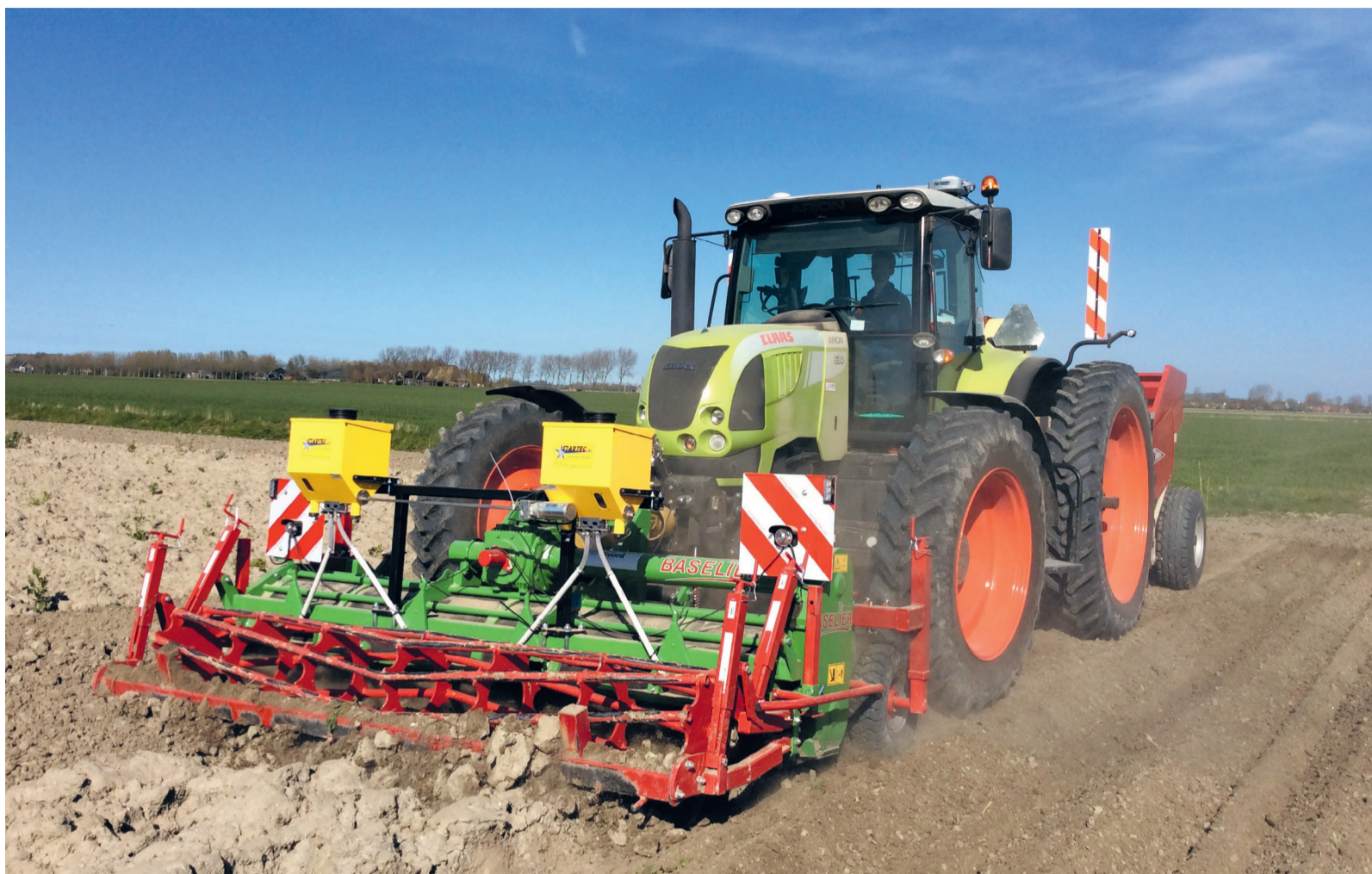
LMB Geertsema produceert sinds 2011 breedspoottrekkers. De kosten van een conversie liggen grofweg tussen de 22.000 en 25.000 euro.