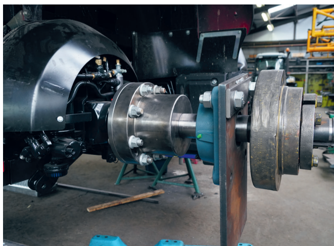
De achteras in aanbouw met zelfontworpen montagebus en assteun. Dit model krijgt tevens een luchtdrukwisselsysteem.