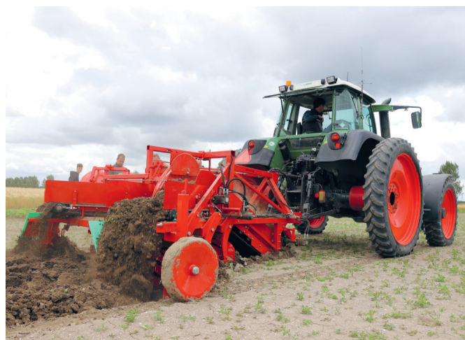
Wageningen University & Research Open Teelten doet onderzoek naar de rijpadenploeg van Steverink Techniek.

'Een egalere sortering en meer opbrengst ondanks de rijpaden. Dat is wat wij uit de praktijk horen', zegt de mechanisatieman uit Munnekezijl. 'Je kunt eerder het land op, omdat je in het voorjaar de vochtige grond niet in elkaar drukt. Het gaat meestal om seizoensrijpaden. Ondanks dat je met oogsten niet op de paden werkt, blijft het lonen.'